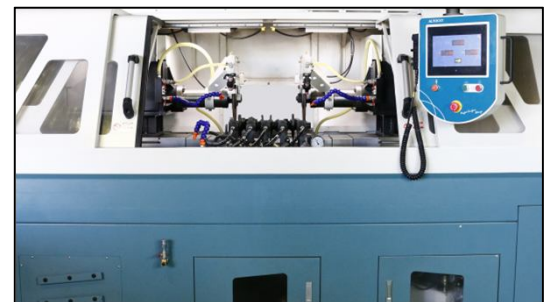
雙主軸自動化切割、多段切割